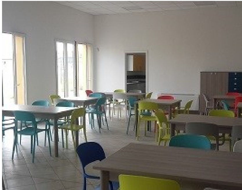
La sala da pranzo