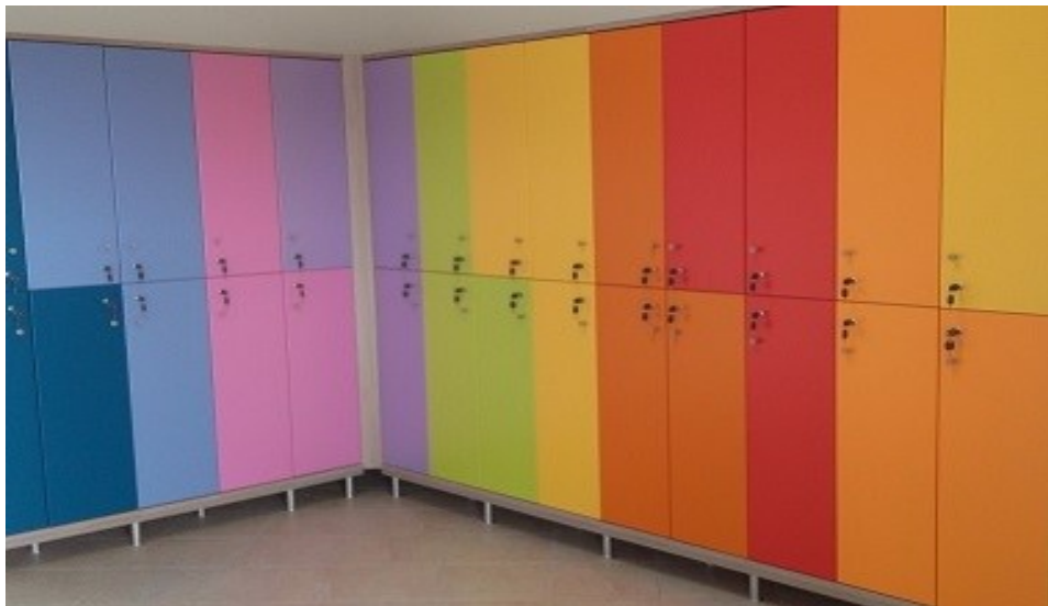
Gli armadietti degli ospiti

e-mail: coordinamento.disabilita@asst-ovestmi.it