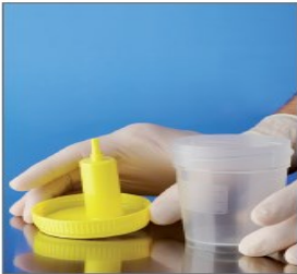
2.放在干净的表面 上，盖子朝上