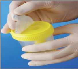
7.部分拉开 保护标签 注意：有针头