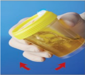
6.将样品转移到试管前 先摇匀样本