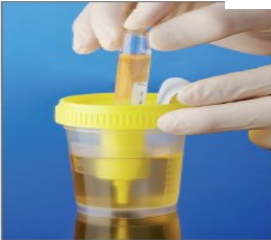
8.插入试管。对试管施加并保持 适度压力。直到完全充满 (停止流动)