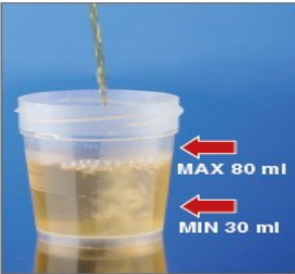
4.在排尿中段采集尿液样本。 将容器装满， 不超过容器容量的 3/4