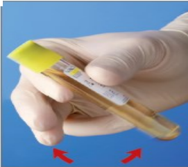
10.装有防腐剂的试管：摇 匀样本（缓慢颠倒 8-10 次）