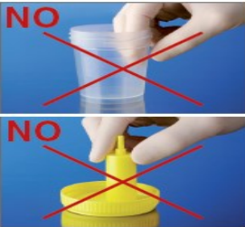
3.切勿触摸容器的内表面 和盖子