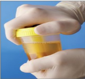
5.顺时针拧紧盖子，盖紧 容器