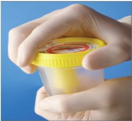
1.仔细清洗 双手和外生殖器 逆时针拧开 并取下盖子